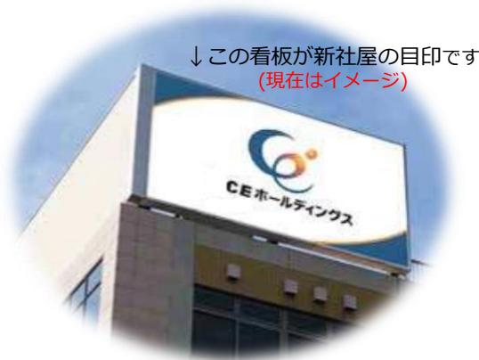
↓この看板が新社屋の目印です (現在はイメージ)

*なお、誠に勝手ではございますが、お祝い等につきましては、お気遣い感謝しつつも謹んで辞退させていただきます。